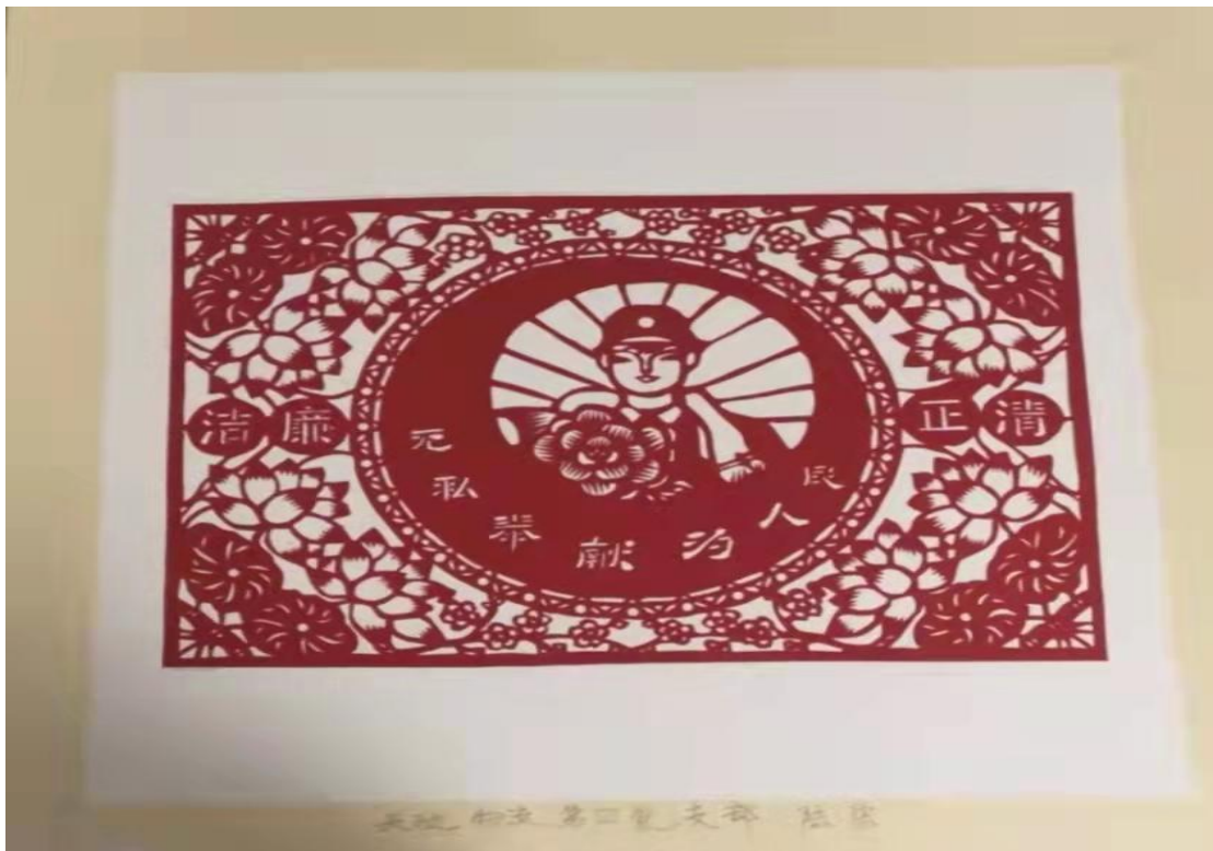
联合商务天驰物流陆宏作品