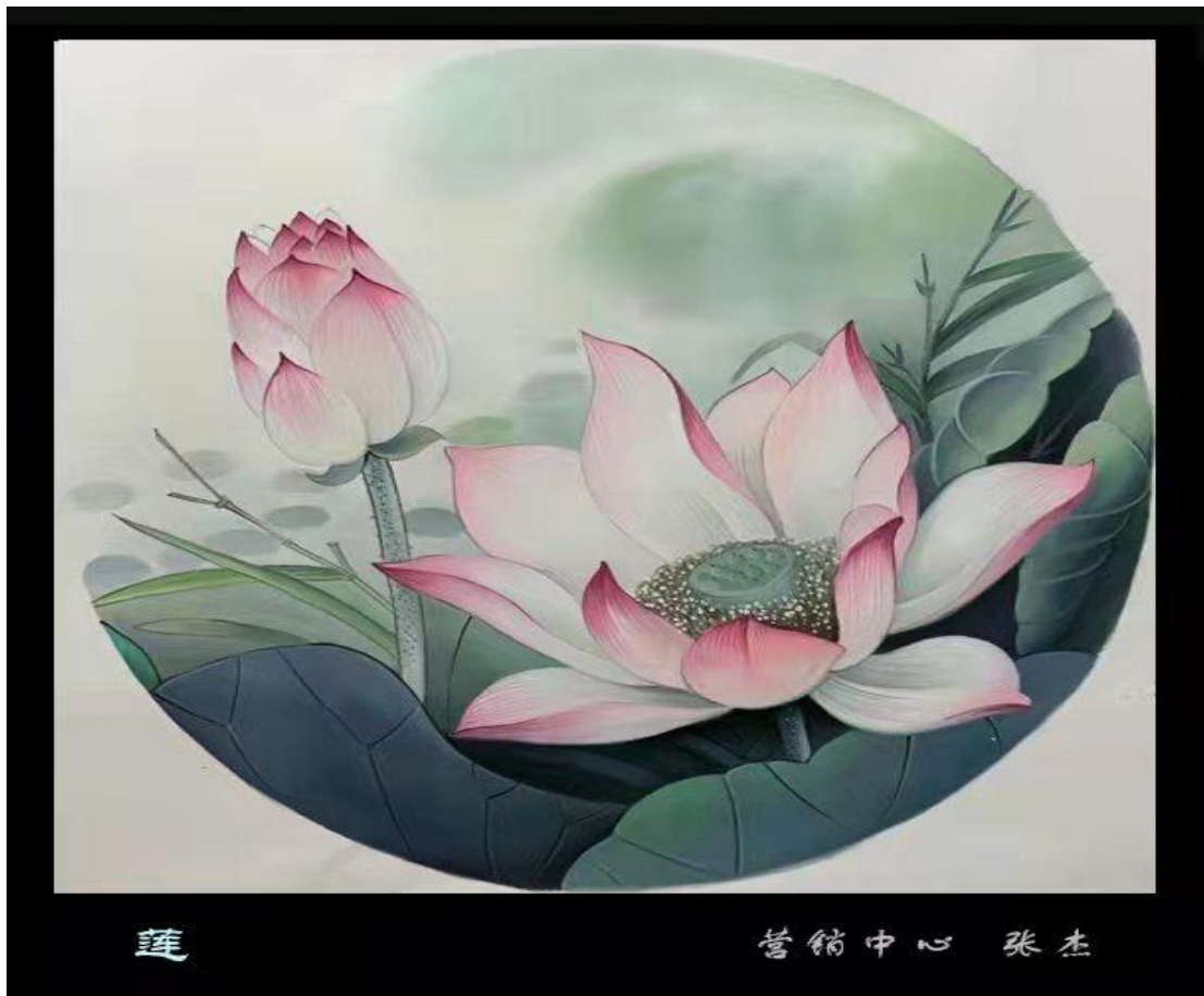
红磷化工张杰作品