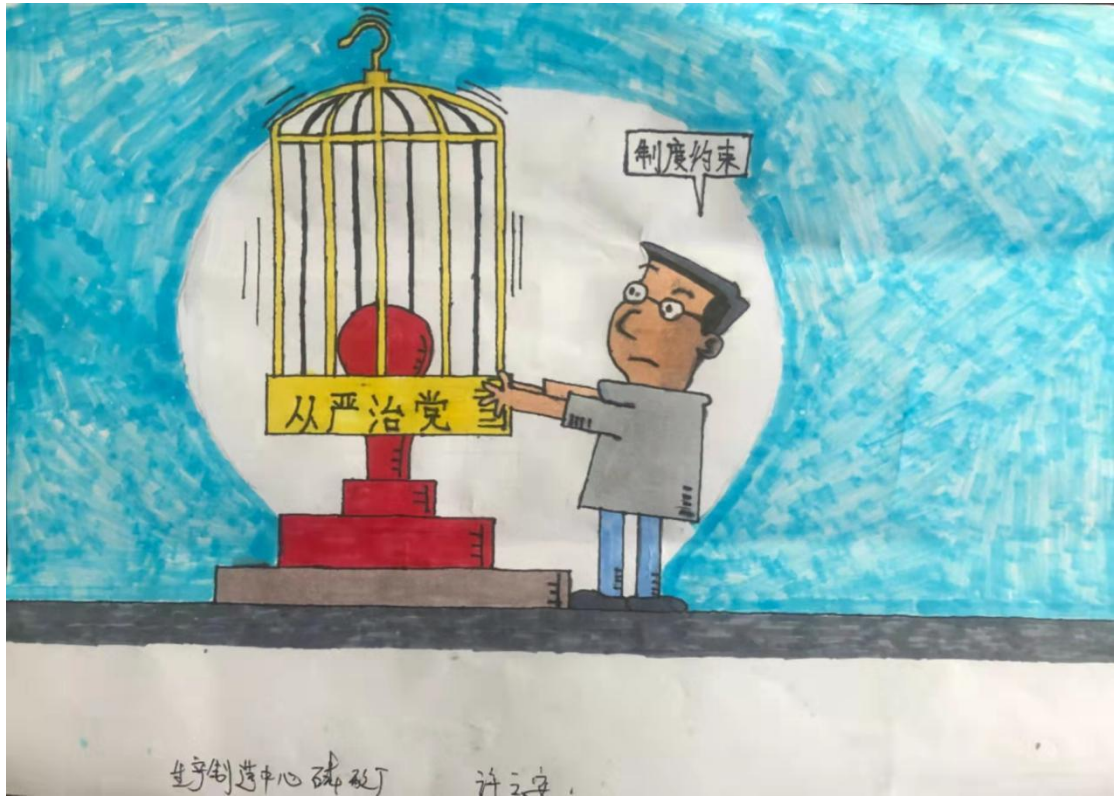
红磷化工许云安作品