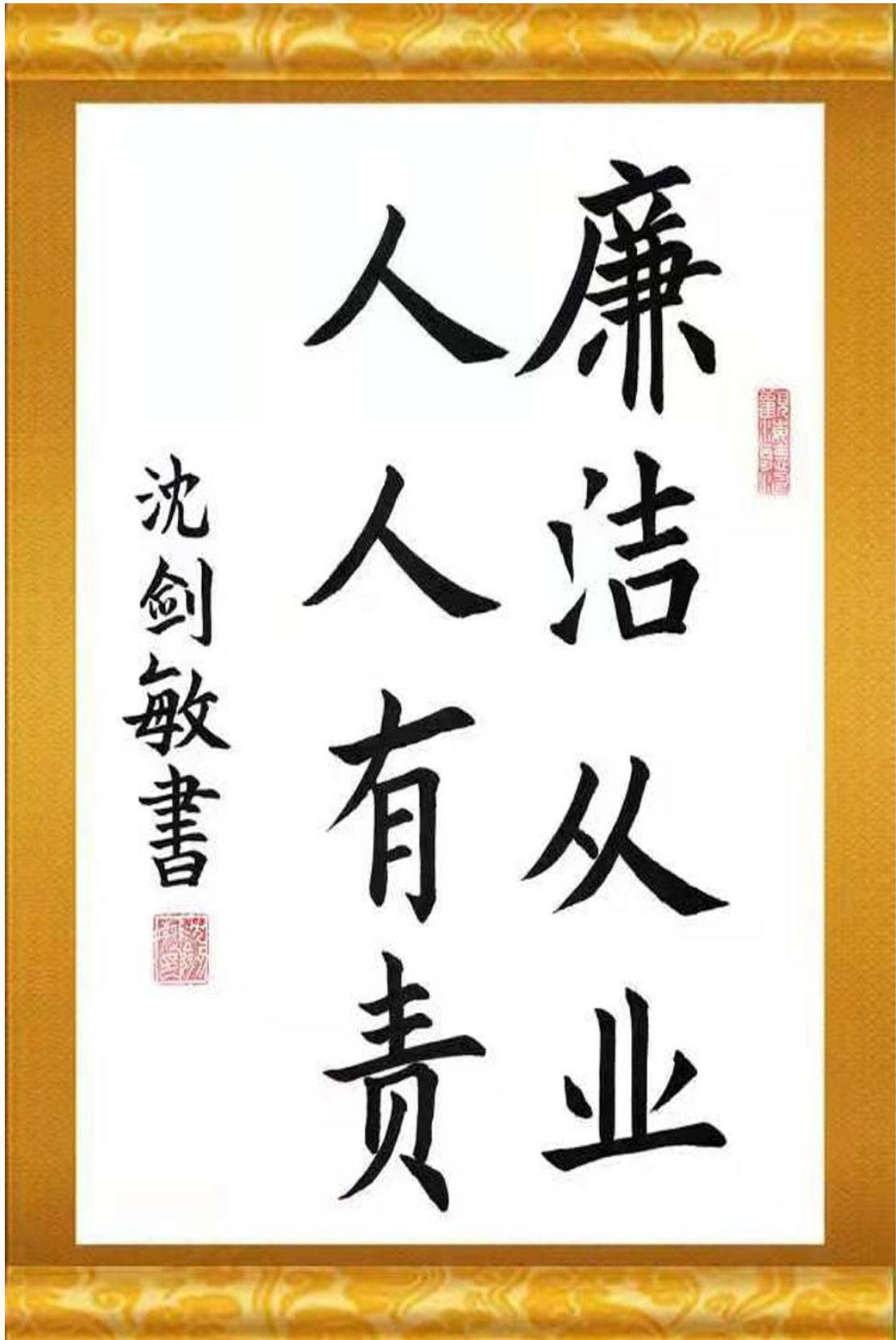
红磷化工沈剑敏作品