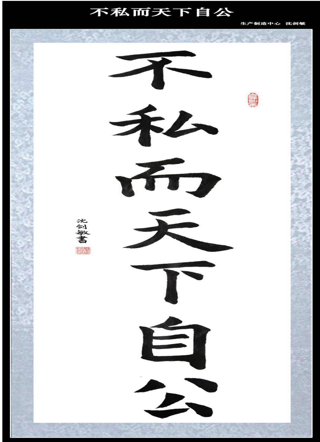
红磷化工沈剑敏作品