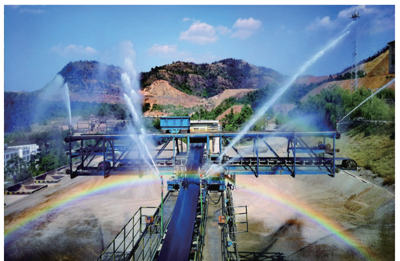
彩虹笼罩

岁月抹去了无数矿山先辈的青春容颜,却沉淀出更多应对风险与挑战的沉着与稳重。面对当前发展遇到的困难,矿山人充分展现出了大局意识和担当精神,在攻坚克难的道路上矿山人必将走得更加从容与自信。上一个50年,我有幸见证并参与了矿山13年的高速发展,矿山人包容与豁达使我不断成长;下一个50年,我将与您不离不弃,拼尽全力为矿山发展而努力。愿公司发展基业长青,生产经营蒸蒸日上。