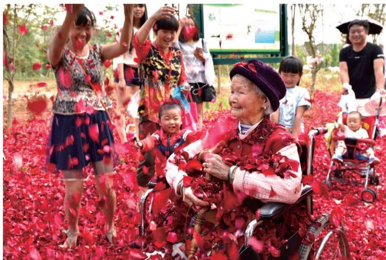
欢乐一家亲

近日,我在天安化工商学院网站上学习了《耶鲁大学化学系实验室安全操作手册》,学习后感触颇深,该手册罗列了各类可能的安全事故与预防措施、应急处置方案,描述非常详尽,让一刚入门的小伙伴读后,都知道该怎么去做。我的工作也会有如COD分析等事项,当深入学习该手册后,我更从容了,我想这就是好规章的魔力吧。