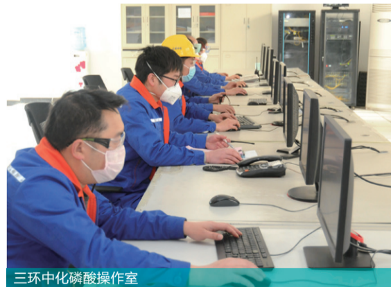
三环中化磷酸操作室

目前,海口工业园区及周边区域聚集了云天化的多家企业,这些企业同处一个区域,同属磷化工产业链,呈现“你中有我、我中有你”的“共生”关系。仅从三环中化